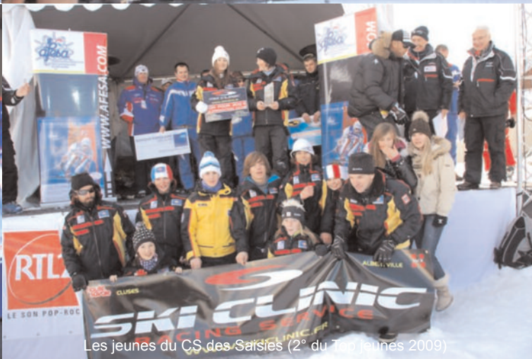
Les jeunes du CS des Saisies (2° du Top jeunes 2009)