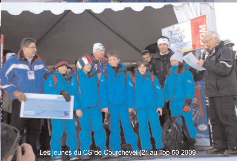
Les jeunes du CS de Courchevel (2° au Top 50 2009)