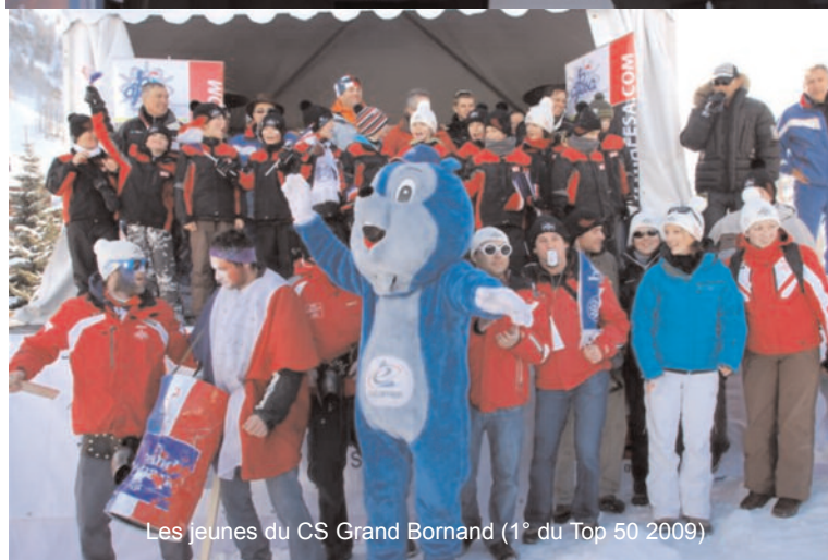
Les jeunes du CS Grand Bornand (1° du Top 50 2009)