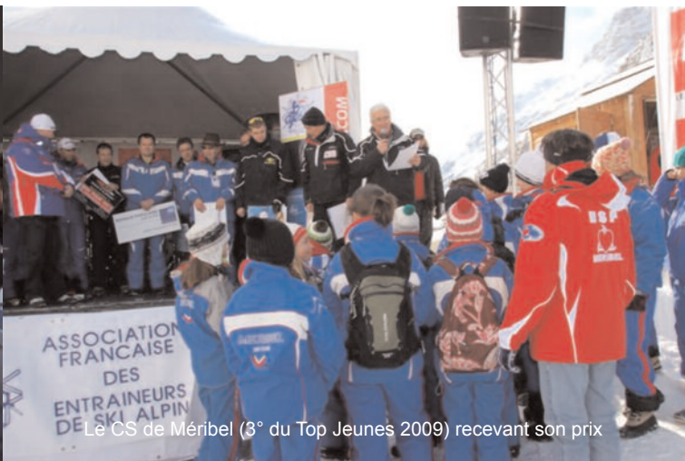
Le CS de Méribel (3° du Top Jeunes 2009) recevant son prix