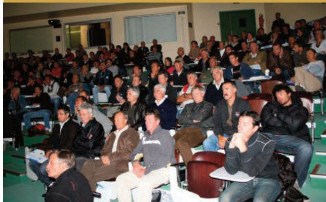
Colloque à l'ENSA - Chamonix en 2008

Assemblée générale de Val d'Isère le 3 décembre 2005. 3e Profestival à l'Alpe d'Huez le 3 décembre 2005 : « La polyvalence en ski alpin de compétition ». Championnat du monde de Bormio (Italie) : aucune médaille française.