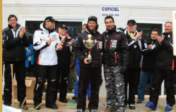
Remise TOP AFESA à Chamonix en 2008