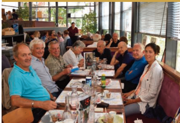
Colloque lors de l'anniversaire des JO de Grenoble en 2018