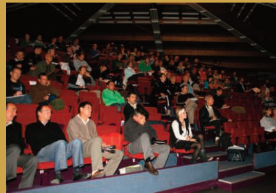
6e colloque médico-technique Le Prisme Seyssins en 2009

Assemblée générale à Val d'Isère le 13 décembre 2008. Colloque national alpin (AFESA-SNMSF-FFS-ENSA) les 3 et 4