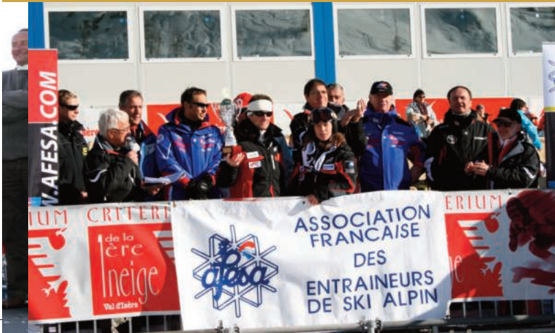
Remise TOP AFESA à Val 'Isère en 2008