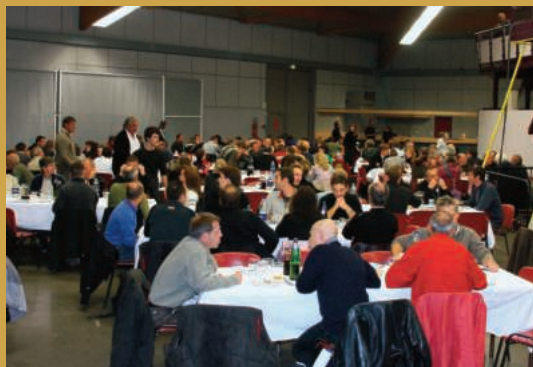
6e colloque médico-technique Le Prisme à Seyssins en 2009