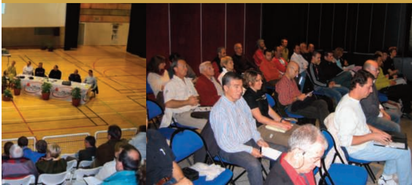
al Alpe d'Huez 2003 5e colloque médico-technique CCI de Grenoble 2006