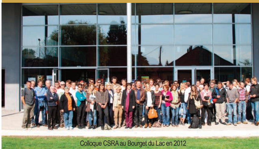
Colloque CSRA au Bourget du Lac en 2012