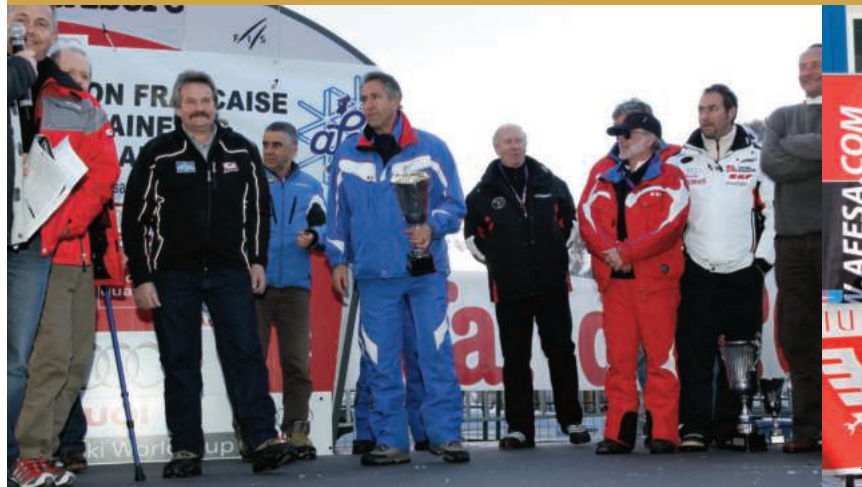
Remise TOP AFESA à Val d'Isère en 2007