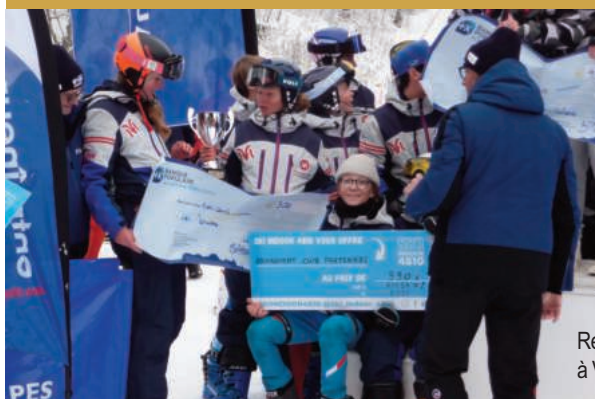
Remise TOP AFESA à Valloire en 2022