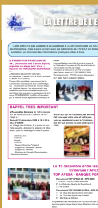
Première "LETTRE DE L'ENTRAINEUR" en 2002