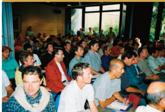
3e colloque médico-technique CCI de Grenoble 2002