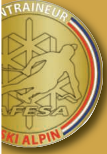
Nouvelle médaille AFESA en 2014