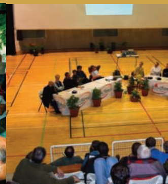
1er Pro-festival Alpe d'Huez