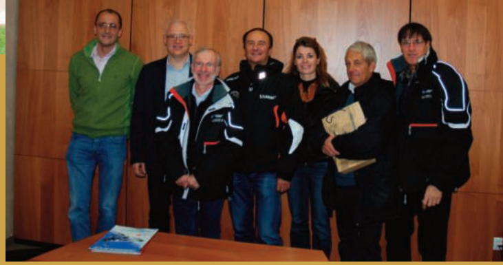
Réception à la Fédération Bulgare de ski à SOFIA en 2010