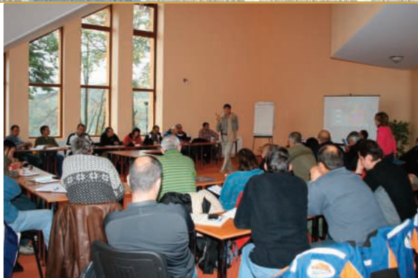
Formation des entraîneurs Roumains en à Brasov en 2009

Alexis Pinturault : médaille d'argent en super-combiné et médaille de bronze en géant aux JO de Pyeongchang.